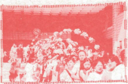
▲花園、豔陽，歡笑 建國國小學生準備前進昌福