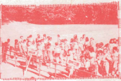
▲鶯歌國小學生準備移撥昌福