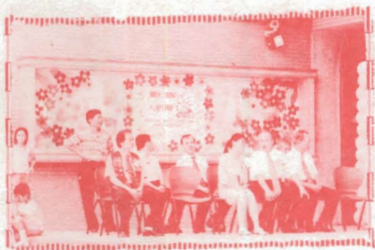
▲多位長官參加「入新厝」盛會

寒流來襲，冷風颼颼，空氣似乎都快凝結了，運動場上傳來孩子們拔河的加油聲，響徹雲霄；為籌募仁愛基金舉辦的跳蚤市場上此起彼落的叫賣聲，令人驚覺孩子們潛力無窮！昌福的孩子在設備新穎完善的環境中快樂學習、自由成長。當校園中傳來悠揚的樂聲，操場上迴盪的加油聲，我們看到無限的希望，更讓人深深憧憬著昌福的未來。