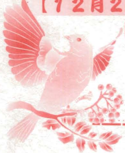
◎九十二年十二月27日熱熱鬧鬧舉辦歲末聯誼餐會，大家獻手藝分享拿手好菜。