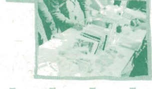
◎九十二年十二月24日設攤參加「跳蚤市場」