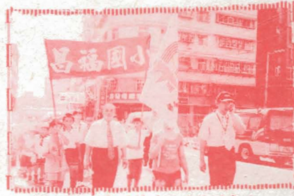
▲加油，大步走吧！快到家了