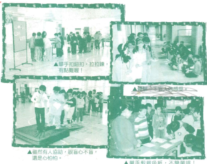
▲單手扣鈕扣，拉拉鍊，有點難喔！