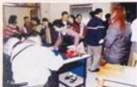
紳士大學講座課程 參加情形