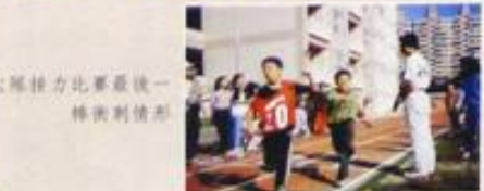
大隊接力比賽最後一 棒衝刺情形