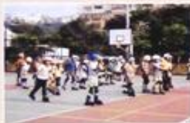
直排輪社團活動情形