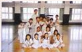
跆拳道隊訓練射擊 教練合影