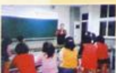
手語班開課校長致詞